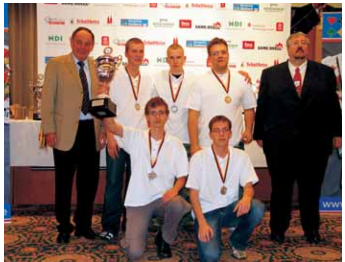
2. Mannschaft Junioren