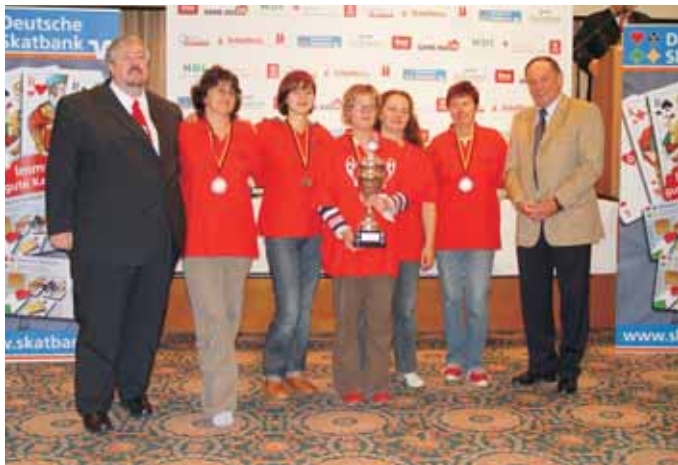
2. Mannschaft Damen