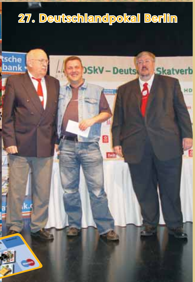
27. Deutschlandpokal Berlin