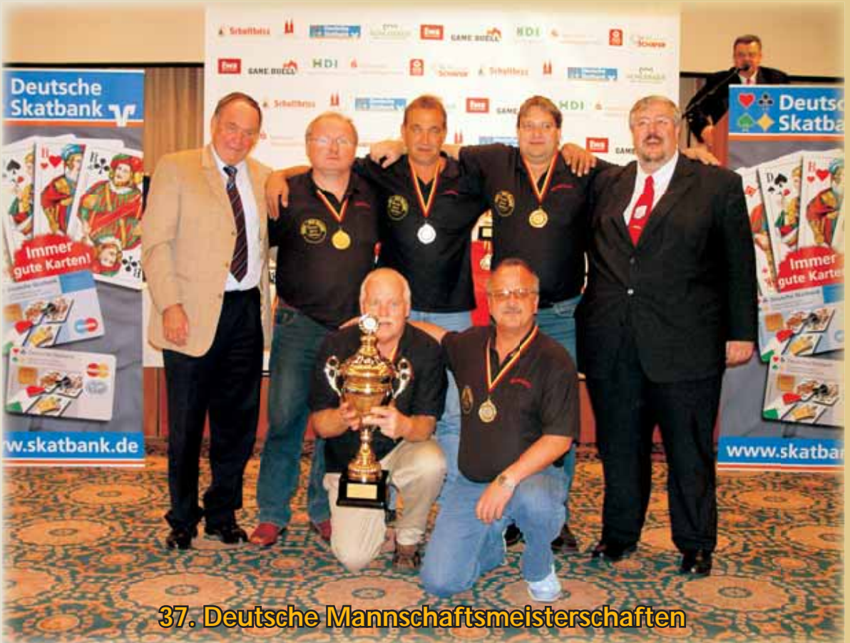
37. Deutsche Mannschaftsmeisterschaften