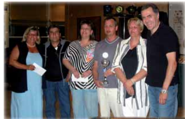
Bil oben: Mixed-Wertung