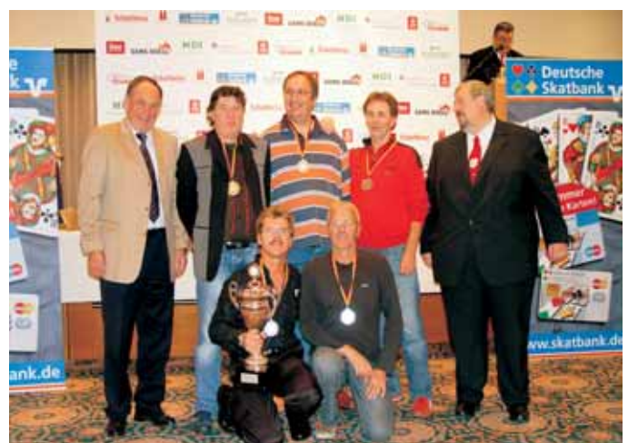
2. Mannschaft Herren