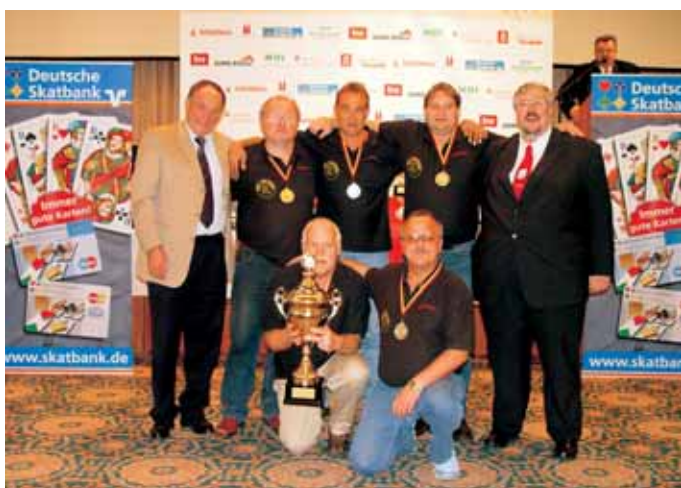
1. Mannschaft Herren