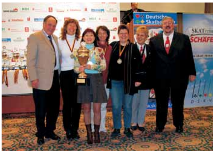
1. Mannschaft Damen