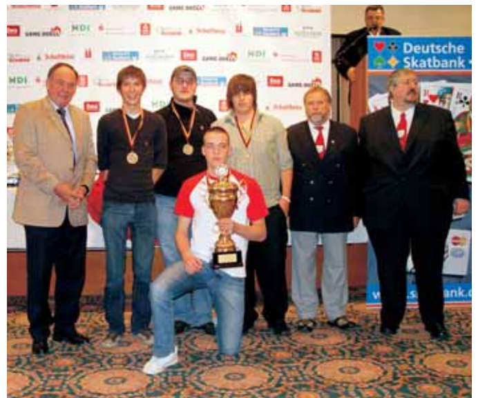
1. Mannschaft Junioren