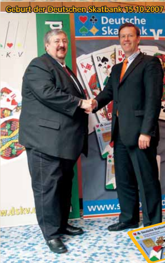
Geburt der Deutschen Skatbank 15.10.2007